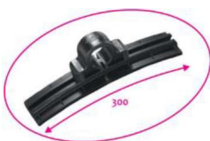
Staffe in dotazione