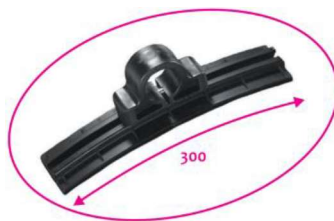
Staffe in dotazione